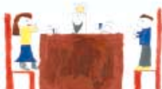
Beyrouth / Beirut

Dieses Projekt wird zwischen Hamburg, Marseille und Siem Reap (Kambodscha) sowie zwischen Rostock, Dunkerque und Gaza fortgesetzt.